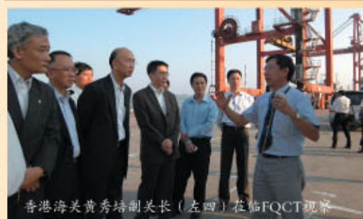
香港海关黄秀培副关长（左四）莅临FQCT视察

2007年9月13日下午，香港海关黄秀培副关长等一行莅临FQCT视察。公司曾炳峰总经理接待并向来宾们详细介绍了公司的经营等情况。